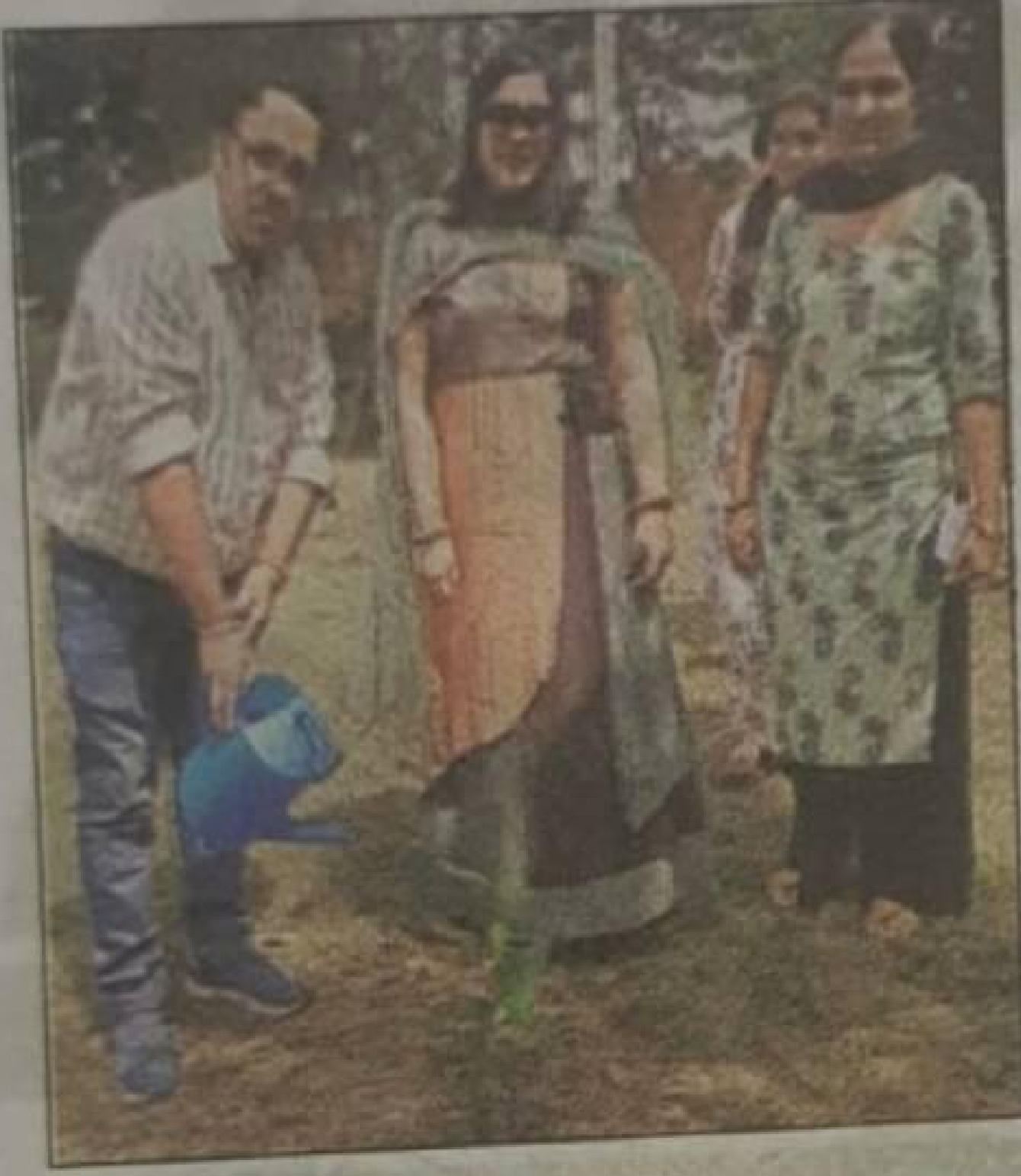
पौधारोपण करते हुए स्टाफ सदस्य।