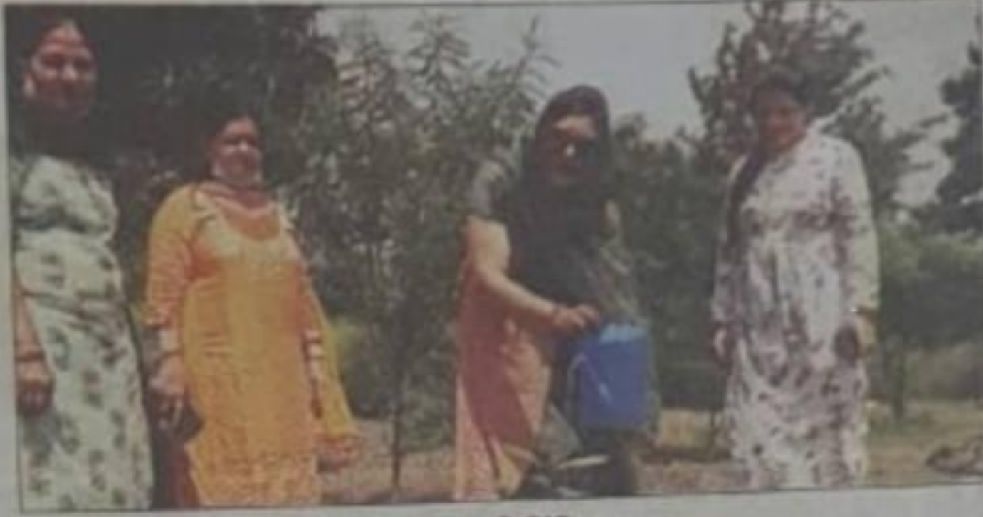
पौधरोपण करती प्रिंसिपल।