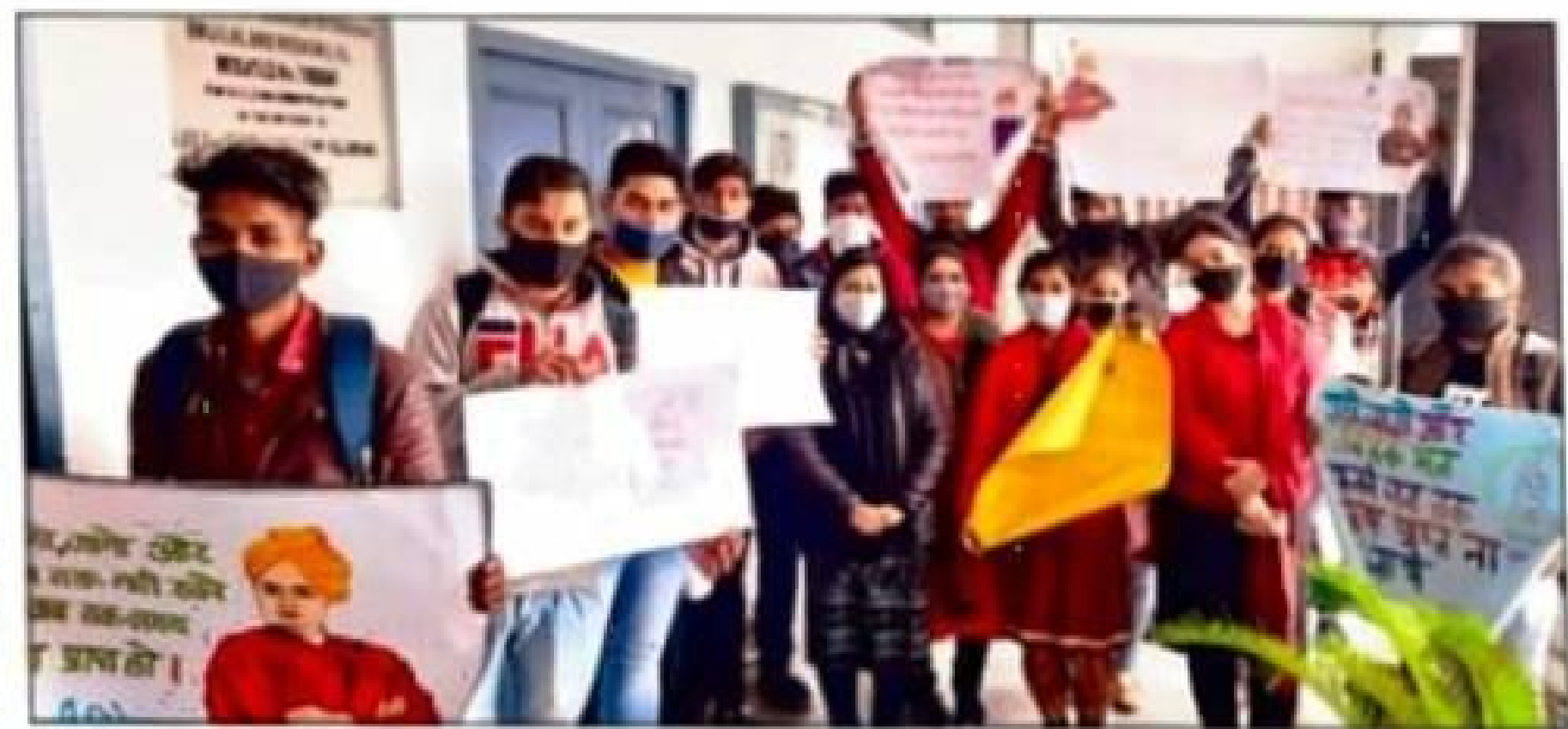
प्रतियोगिता के दौरान अपने-अपने स्लोगनों के साथ डी.ए.वी. कालेज पूंडरी के विद्यार्थी।