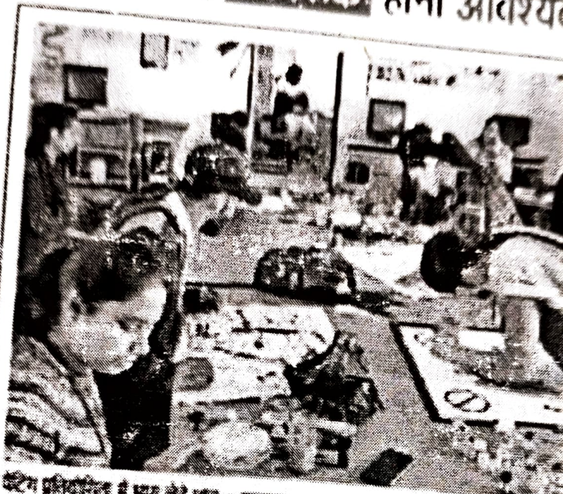
प्रतियोगिता में भाग लेते छात्र - जगदल